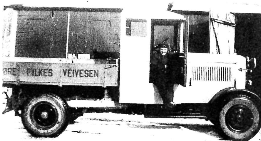
Biletet viser bilen med sjåfør Theodor Aarønes i bildøra