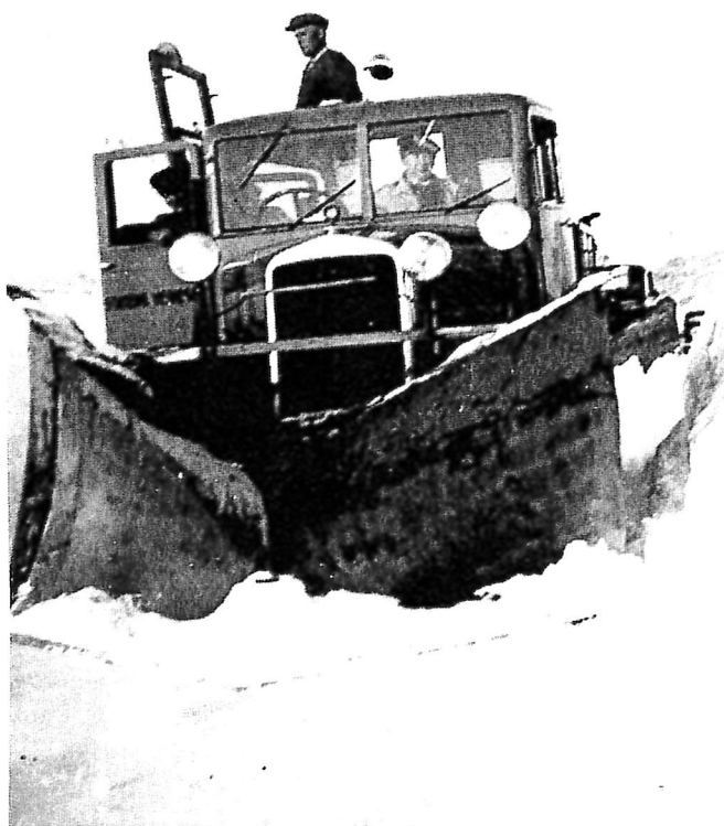
Bilete 4 og 5 er frå brøyting vinteren 1939-40 med Scandia Vabisvogn 1939 modell. Det var då 2\frac{1}{2} m snø på flat mark og snøkantar over 5 meter høge. På siste bilete kan ein sjå korleis sideploegen har forma snøkantane trinvis nedafrå og oppover. Theodor Aarønes var brøytesjåfør.